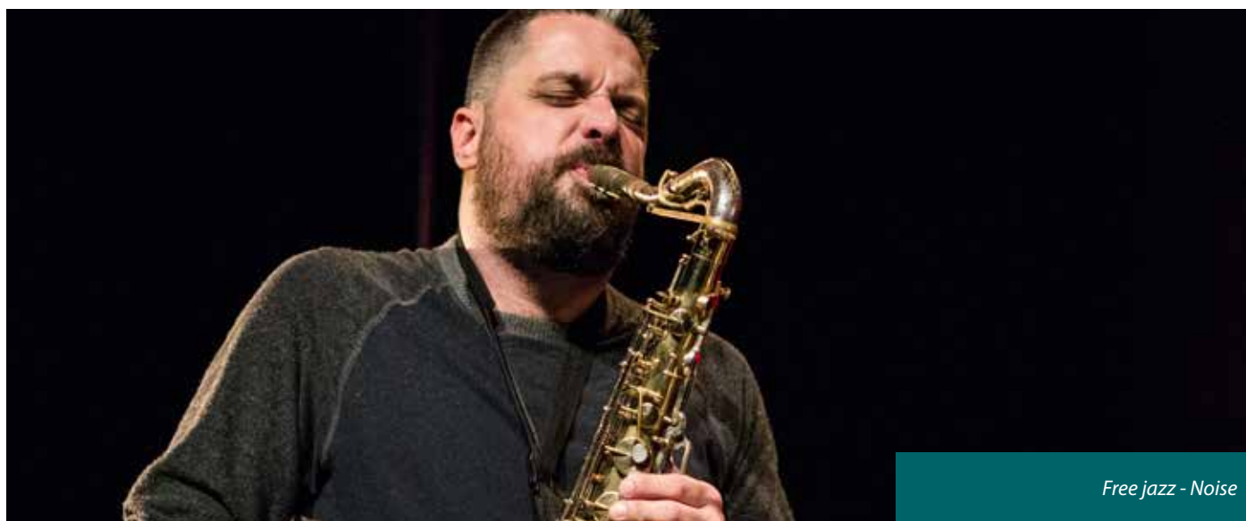
Dave Rempis

Samedi 17 novembre à 20h || La malterie 250 bis bd Victor Hugo, Lille 7- 9€ / Tout public