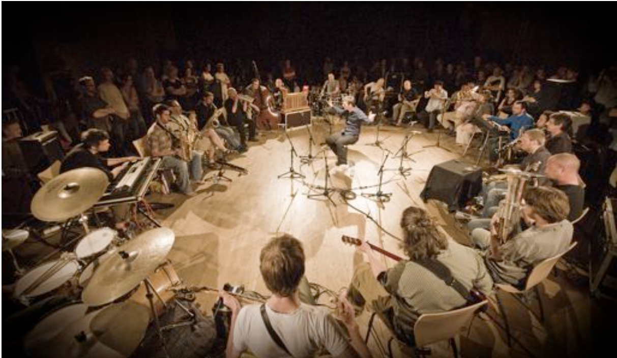
Concert d'Ellipse - Festival Musique Action Vandoeuvre, 2008

Direction et composition : Olivier Benoit