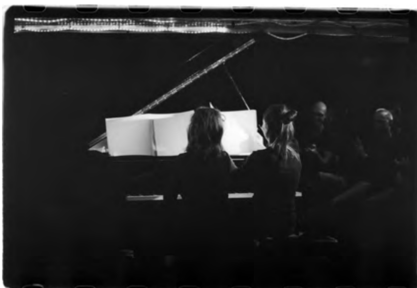
Concert AGNe1 / dANG la malterie Lille, juin 2016