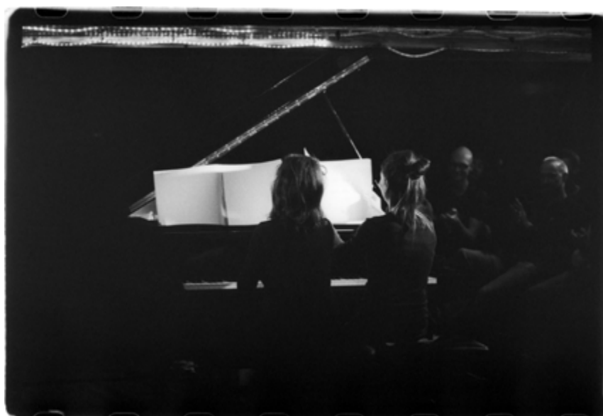
Concert AGNe1 / dANG la malterie Lille, juin 2016