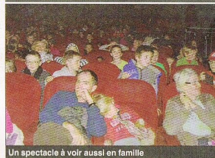
Un spectacle à voir aussi en famille