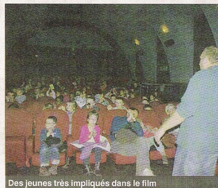
Des jeunes très impliqués dans le film

Un grand moment pour les petits cinéphiles.