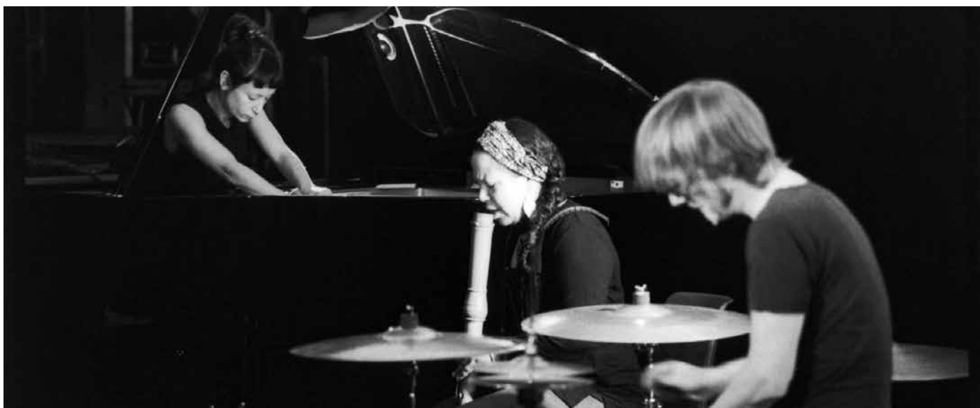
Abdou/Dang/Orins © Philippe Lenglet

Mardi 12 mars à 20h30 | la malterie 250 bis boulevard Victor Hugo, Lille 5-7€/Tout public