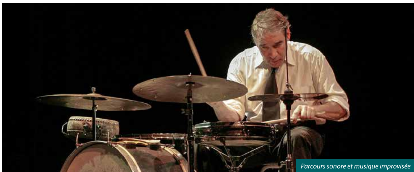
Paul Lovens

Dimanche 17 mars à 15h | Villa Cavrois 70 avenue Kennedy, Croix 6,50-8€ - Gratuit / Tout public