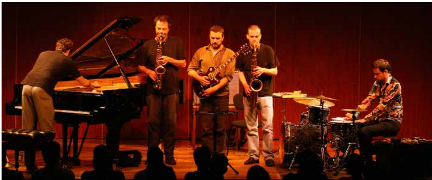
Hubbub © Joaquim Mendes

Mercredi 13 mars à 20h30 | la malterie 250 bis boulevard Victor Hugo, Lille 7-9€ / Tout public