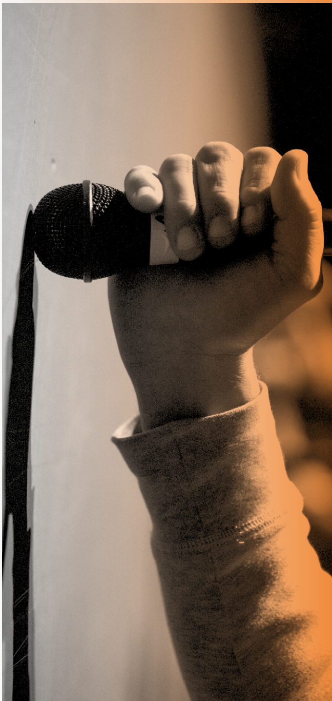
Carole Rieussec, Partition pour microphone, riverrun 2017