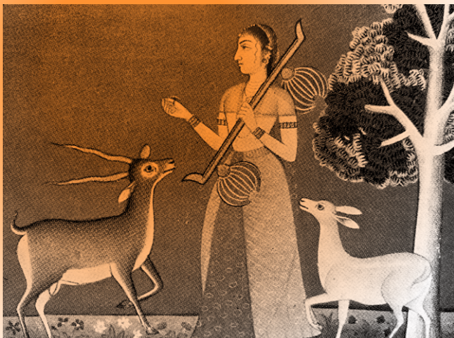
Extrait de la peinture de Ragini Todi