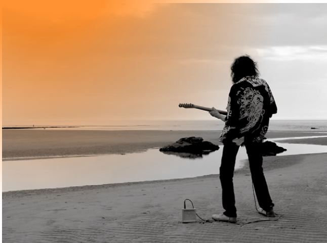
© Don Pauvros de la Manche