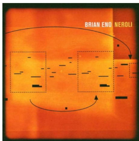
Pochette de Neroli de Brian Eno (1993)

à son interprétation musicale pour une écoute polysensorielle unique. Le public est invité à une expérience d'écoute singulière, confortablement installé sur des transats dans un état lumineux crépusculaire afin de créer une situation corporelle de lâcher-prise dans son parcours d'écoute. Cette performance sonore est associée à une expérience olfactive évolutive autour de l'essence de néroli grâce à des variations de fragrances diffusées. Cela afin de créer une expérience sensorielle originale dans un espace de rêverie introspective au travers de ce dialogue singulier entre l'ouïe et l'odorat, deux sens de l'invisible.