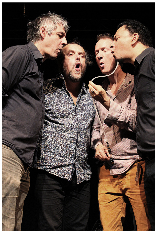
Résidence artistique WABLA au Grand Mix (Tourcoing) - 2017